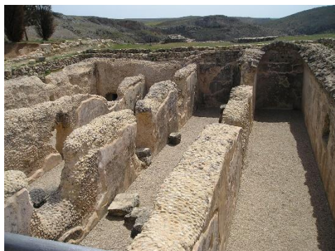
Cisterna da época do Império Romano