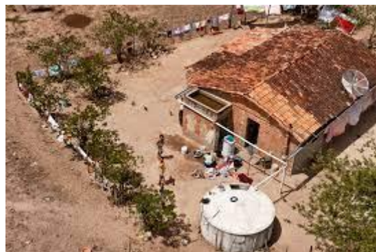
Cisternas atuais usadas no sertão brasileiro

Agora é com você! Observe seu entorno e identifique um problema. Depois, sozinho ou com seus familiares ou colegas, construa uma proposta de solução para ele.