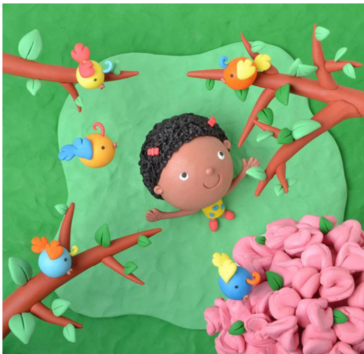
Livro: Alice vê Escritora: Sonia Rosa Ilustradora: Luna Editora: DCL Luna fez ilustrações usando massa de modelar.

Como vemos nos exemplos, as possibilidades para criar uma ilustração são diversas, podemos usar: fotografia; aquarela; colagem; tecidos; objetos etc.