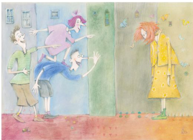
Livro: Nós Escritora e Ilustradora: Eva Furnari Editora: Moderna

b. Apresente livros com ilustrações variadas. Veja os exemplos: