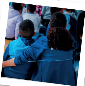
Crianças de costas