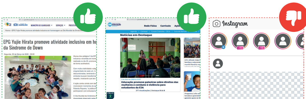
Portal da Prefeitura de Guarulhos

Imagens, vídeos e registros de estudantes deverão ser armazenados exclusivamente em ambiente institucional autorizado, com controle de acesso, finalidade definida e prazo de guarda compatível com a necessidade administrativa ou pedagógica, sendo vedado o armazenamento permanente em celulares, computadores ou nuvens pessoais de servidores.