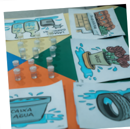
Registros das produções