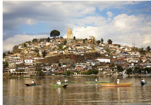
Pátzcuaro – Michoacan