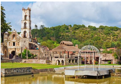
Huasca de Ocampo – Hidalgo