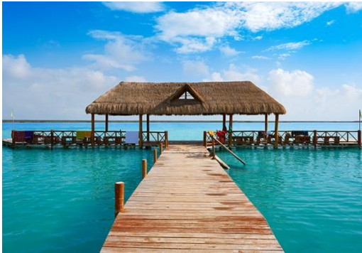
Bacalar – Quintana Roo