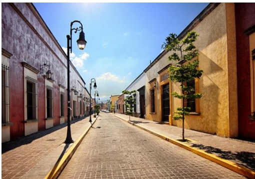
Tequila – Jalisco