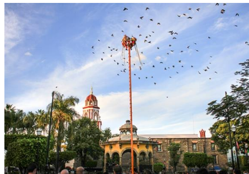
Papantla – Veracruz