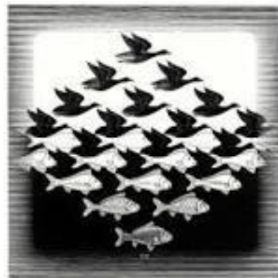
Escher, Céu e Água I – 1938.

2- Qual a sua cor preferida? Procure em seu local de vivência objetos variados apenas dessa cor, podem ser meias, brinquedos, lápis, potes plásticos, roupas, cobertores. Monte com eles uma escultura. Depois de pronto você pode tirar uma foto de sua obra monocromática, ou seja, de uma cor só.